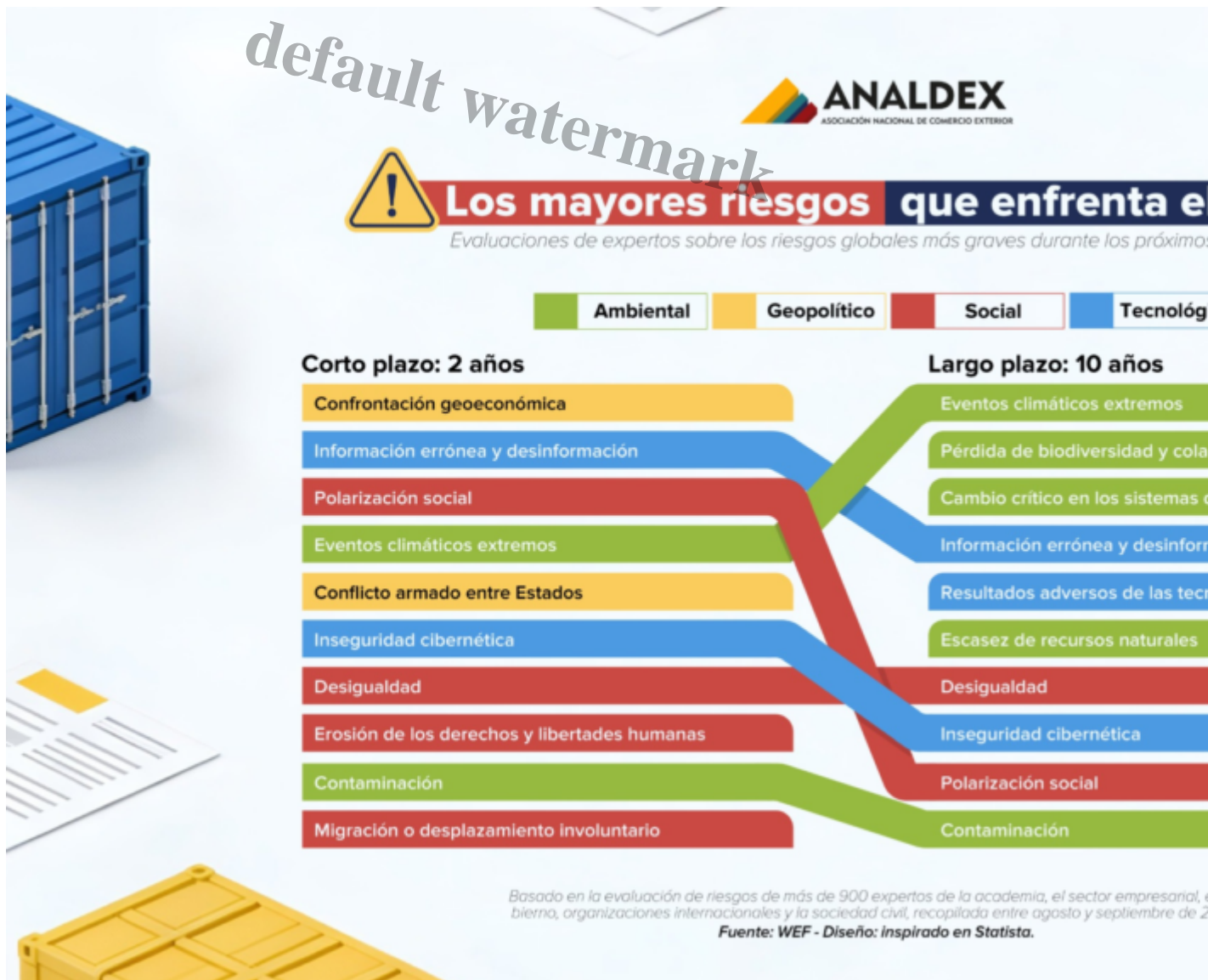
Ilustración 2. Riesgos globales

El World Economic Forum, a través de su informe The Global Risks Report 2026, confirma la creciente relevancia de los riesgos ambientales. Resaltando que, si bien en el corto plazo otras preocupaciones han ganado espacio en la agenda global, en el largo plazo los riesgos asociados al clima siguen siendo los más críticos, encabezados por los eventos climáticos extremos. Este diagnóstico refuerza la idea de que el cambio climático constituye un elemento estructural del entorno macroeconómico, capaz de amplificar desequilibrios y afectar de manera sostenida el crecimiento económico y los flujos de comercio internacional.